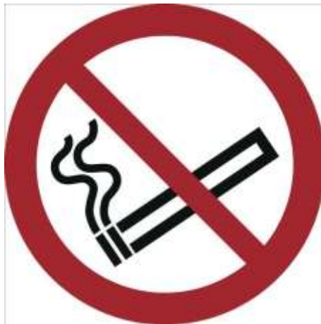
Ne pas fumer pendant la manipulation ou le remplissage d'éthanol